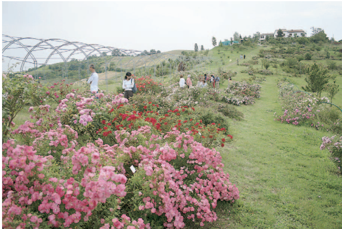
PROFUMI Uno dei percorsi del Museo Giardino della Rosa Antica nel modenese

Le notizie su tutti i giardini e sulle manifestazioni, che comprendono anche concerti al tramonto, concorsi, aperitivi serali, cacce al tesoro, momenti dedicati al benessere e al buon cibo, si trovano su uno dei siti più visitati dell'Horticultural Tourism, www.grandigiardini.it , tel. 031.756211.